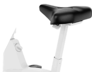
Vérin à gaz